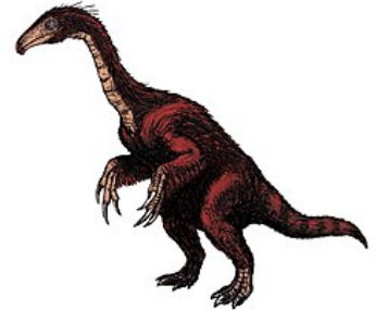
Illustration av Segnosaurus , en typisk Therizinosauroid.

Stratigrafisk utbredning: Äldre krita - Yngre krita